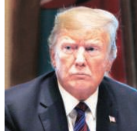
हेराफेरी के दोषी, ऐसा करने वाले पहले अमेरिकी पूर्व राष्ट्रपति

इसी के साथ वह किसी गंभीर अपराध के लिए दोषी ठहराए गए अमेरिका के पहले पूर्व राष्ट्रपति बन गए। ऐसे में नवंबर में होने वाले राष्ट्रपति चुनावों में शामिल हो एक बार फिर से व्हाइट हाउस पहुंचने की उनकी उम्मीदों की राह में कानूनी चुनौतियां बढ़ती दिख रही हैं। मैनहट्टन के 12 जूरी सदस्यों के एक समूह ने गुरुवार को एक ऐतिहासिक फैसले में कहा कि वे सर्वसम्मति से इस बात पर सहमत हैं कि 77 वर्षीय ट्रंप ने पॉन स्टार डेनियल्स को 130,000 अमेरिकी डॉलर की राशि का भुगतान छिपाए के लिए व्यावसायिक रिकॉर्ड में हेराफेरी की। यह निर्णय लगभग डेढ़ दिन के विचार-विमर्श के बाद आया है। इस फैसले के बावजूद ट्रंप को नवंबर में होने वाले चुनाव में खड़े होने से नहीं रोका जा सकता, लेकिन यह लगभग तय है कि वह इसके