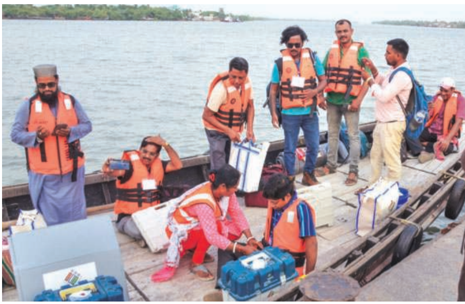
पश्चिम बंगाल के उत्तर 24 परगना जिले में नाव के जरिये मतदान सामग्री ले जाते मतदानकर्मी

उत्तर प्रदेश में इस चरण की 13 लोक सभा सीट में महाराजगंज, गोरखपुर, कुशीनगर, देवरिया, बांसगांव