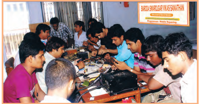
बड़ौदा स्वरोजगार विकास संस्थान ( बीएसवीएस ) बड़ौदा आर-सेटी केंद्रों द्वारा युवाओं को सशक्त करने हेतु प्रशिक्षण दिया जा रहा है।

कर रहे हैं। वित्तीय वर्ष 15-16 में 38,678 युवा लाभार्थियों को इन केंद्रों पर प्रशिक्षित किया गया।