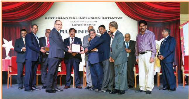
बैंक को आईबीए द्वारा बड़े बैंकों की श्रेणी में "बेस्ट फ़ाईनेंशियल इक्लूजन इनिशिएटिव" के लिए फ़र्स्ट रनर अप अवार्ड मुंबई में बैंकिंग टेक्नोलॉजी अवार्ड 2016 में प्रदान किया गया.