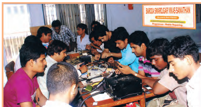
Youth being trained and empowered by Baroda Swarojgar Vikas Sansthan (BSVS), [Baroda R-SETI Centers].

the youth and imparting them knowledge and skills required for taking up self-employment ventures. During FY16, 38274 youth beneficiaries were trained at these centres.