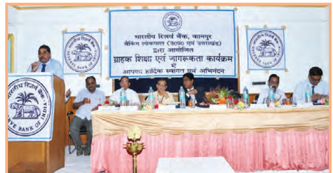
Customer education and awareness camp by Bank & Reserve Bank of India at Faizabad Region

The desired objective of Financial Inclusion can be achieved only when enough demand for banking services is generated from the targeted group of population. In order to invoke responses amongst villagers, it requires financial literacy on various banking facilities and its benefits particularly the benefits of savings habit, Aadhaar seeding, maintaining minimum balance, eligibility for availing Overdraft, use and safekeeping of RuPay cards and its pin, USSD facility, eligibility of availing accidental & life insurance, lodgment of claim under insurance, micro insurance products, pensions, benefits of KCC, GCC, prompt repayment, availability of other retail and SME loans to them. Financial literacy would be the key to success of financial inclusion initiatives of the Bank. Your Bank’s link branches and BCs are organizing Financial Literacy campaign regularly by conducting meetings in their service area villages and schools.