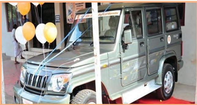
दया रीहेबिलिटेशन ट्रस्ट, वडागरा, कोझिकोड केरल को एम्बुलेन्स खरीदने के लिए दान देते हुए।

आपके बैंक द्वारा सीएसआर के क्षेत्र में जो कदम उठाए गए, वे निम्नलिखित हैं: