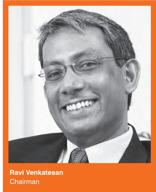
Ravi Venkatesan Chairman

Technology will play a critical role in revitalizing our Bank. Information is the lifeblood of a bank and banks are increasingly very sophisticated information processing units. Our Bank has a solid technology foundation with good infrastructure, core banking system and good software for communication and collaboration. Importantly, the Bank has also devoted significant attention to ensuring cybersecurity and privacy. Over the next few quarters, there will be a significant upgradation of capabilities in four areas. First, in reengineering and automating core business processes to enable speed, efficiency and control. Second, in closing the gap in internet and mobile banking. Third, in improving our capability in the vital area of big data and analytics. And finally, in transforming into a more digitally savvy Bank where