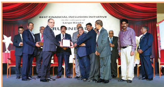
Bank was awarded as First Runner up for "Best Financial Inclusion Initiative" in the category of Large Banks by IBA during Banking Technology Awards 2016 at Mumbai.